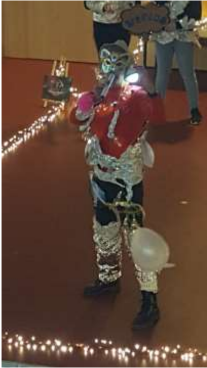
Flitsend van start met Tijd en Ruimte