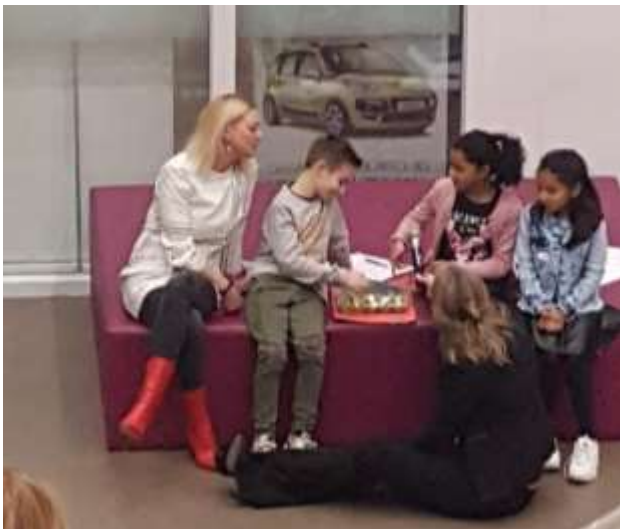
tijdens nieuwjaarsreceptie van Blick