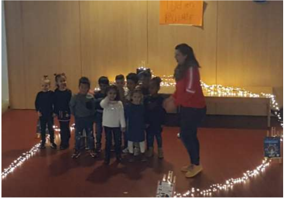
Presentatie ouder - kind gesprek