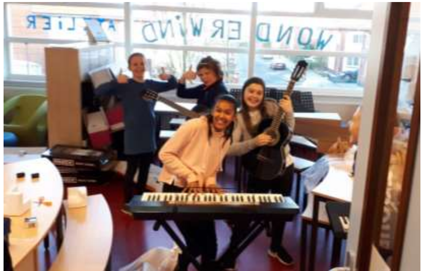
Meiden pakken uit!

Op de Wonderwind leren kinderen hun grenzen te verleggen door in verwondering de wereld te verkennen. Zij zetten met vertrouwen hun talent in en nemen, gestimuleerd door leerkrachten en ouders, steeds meer verantwoordelijkheid voor hun eigen leerproces.